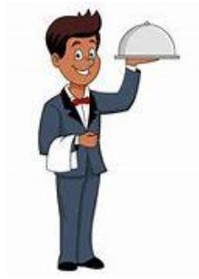
Mr. Glass waiter