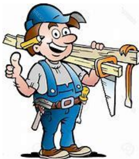
Mr. Wood carpenter