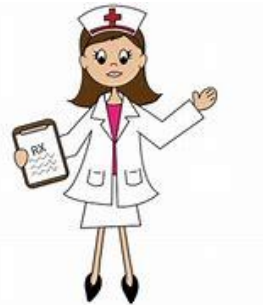
Miss Lane nurse