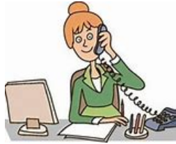
Miss Swift secretary