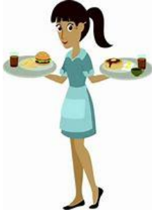
Miss Butler waitress